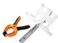
Zestaw do mocowania miernika nasłonecznienia do paneli PV