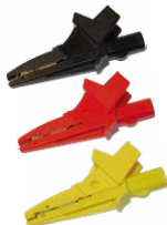
Krokodylek 1 kV 20 A czarny / czerwony / żółty