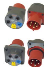
Adapter gniazd trójfazowych 16 A / 32 A