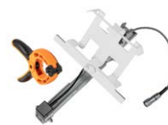
Zestaw do mocowania miernika nasłonecznienia do paneli PV + sonda do pomiaru temperatury paneli PV oraz otoczenia