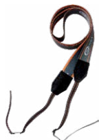
Szelki do miernika (typ M1)